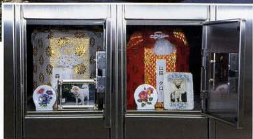
▲ペット納骨堂 (八角堂)